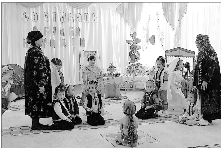
И вот, наконец, долгожданный праздник! Зал украшен. В одной стороне зала – татарская изба с её национальным бытом: кровать с различными прошвами,