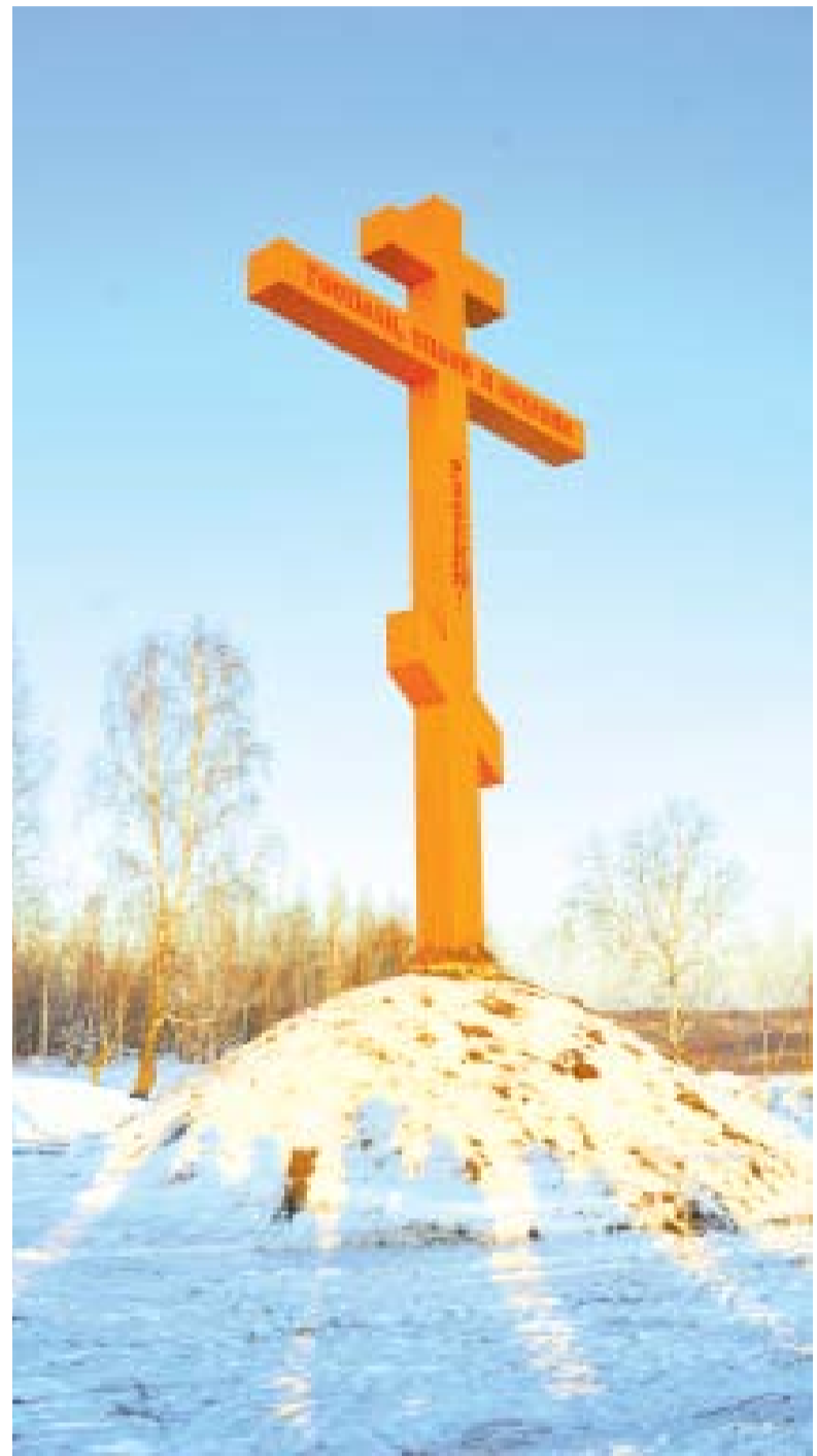
Поклонный крест — современная дань Памяти

Первый известный памятник древнерусской литературы тобольского происхождения является коротким, хронологически выдержанным переказом истории покорения Сибири, давший хорошую основу последующим летописцам. Точен он или нет... Да так ли это важно теперь? Ведь на каждое событие есть разные взгляды. И участники тех