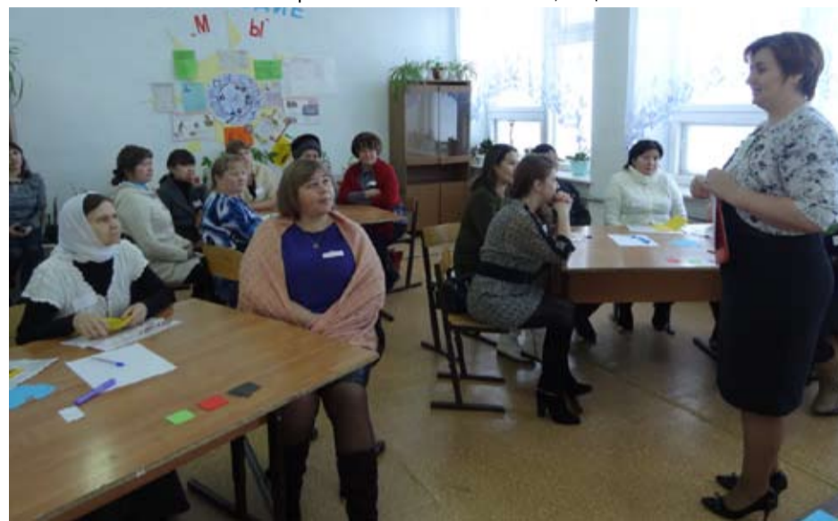
Идёт беседа в «мастерской общения»