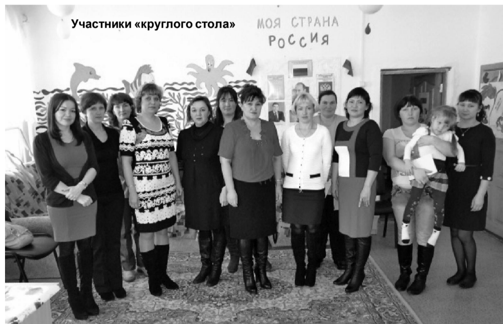
Участники «круглого стола»