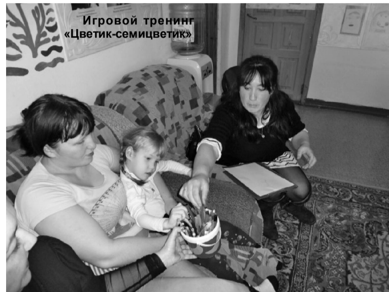
Игровой тренинг «Цветик-семицветик»

посещать. Искренне жаль, что подобные мероприятия проходят без должного внимания населения. Со своей стороны могу сказать, что так поступили они абсолютно зря, потому что даже мне, казалось бы, незаинтересованному человеку, встреча показалась интересной и информативной.