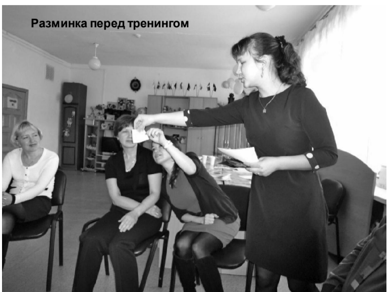
Разминка перед тренингом

Поэтому смотрите сами: хотите получить помощь от государства - начните с опеки. Если же хотите иметь своего ребенка