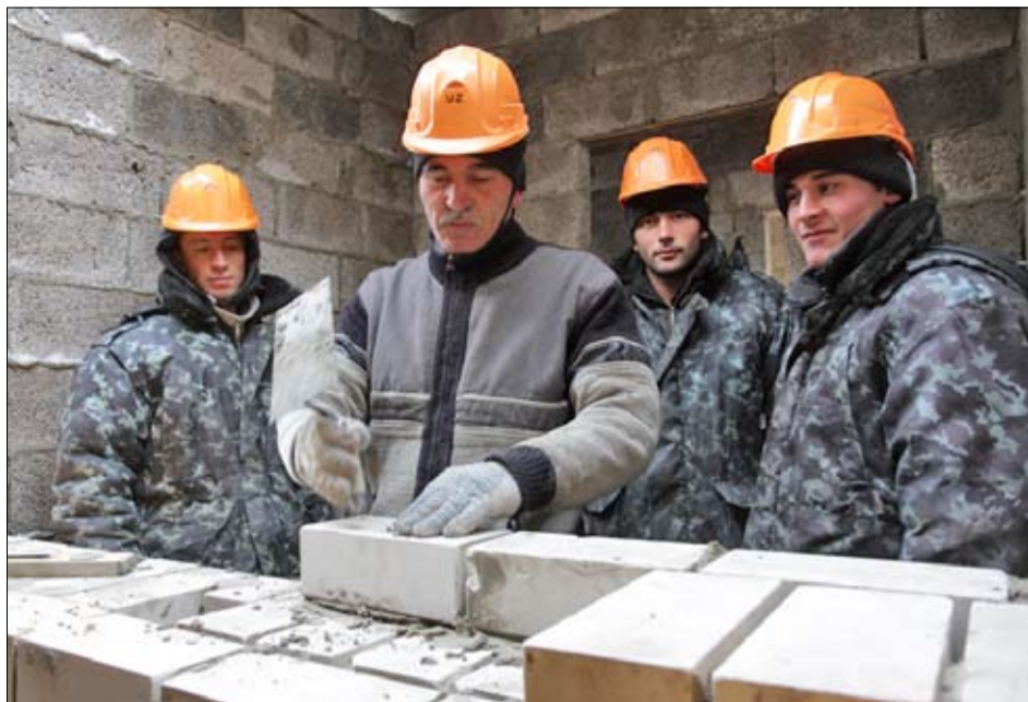
Мастер-класс от Низама

В июле стройплощадка в Бизино ожила: были завезены керамзитовые блоки, облицовочный кирпич, плиты перекрытия и другие материалы, а вскоре началось возведение наружных и внутренних стен здания, отделка фасада. Главными исполнителями в этот трудоёмкий период строительства жилого дома стали каменщики. Они работали напряжённо, поэтому за неделю до Нового года два этажа практически готовы, а