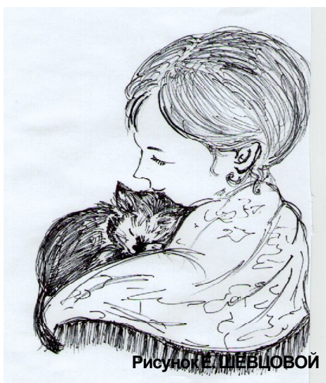
Рисунки Е. ШЕВЦОВОЙ

Милосердие было главной чертой православного человека