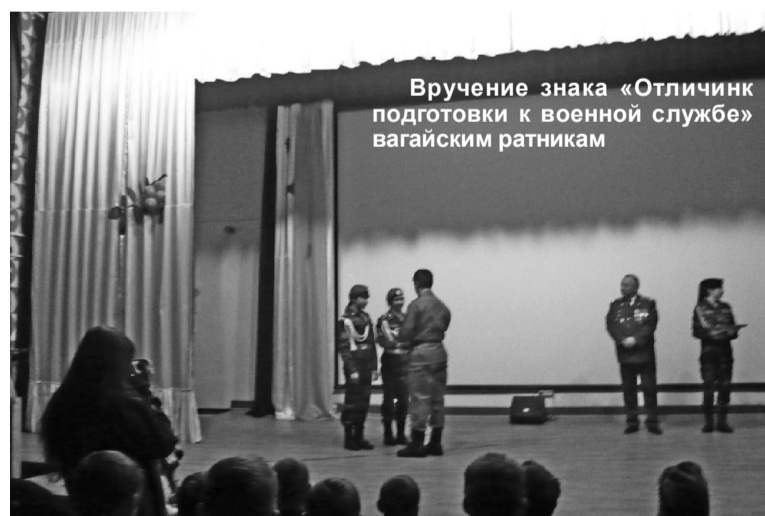
Вручение знака «Отличник подготовки к военной службе» вагайским ратникам

Пятого декабря началось контрнаступление советских войск под Москвой в 1941 году, у мемориала памяти воинам-заводоуковцам, погибшим в годы Великой Отечественной войны, состоялось возложение цветов и гирлянд. С напутственным словом выступили ветераны войны - участники битвы под Москвой. Завершился слет в Заводоуковском городском дворце культуры, где для всех участников организаторы воссоздали летопись главной темы слета. Тринадцатый областной слет юных ратников проводил областной детско-юношеский центр «Аванпост» при поддержке областных департаментов по спорту и молодежной политике, образованию и науке, а также областного совета ветеранов войны и труда и депутатов Тюменской областной думы.