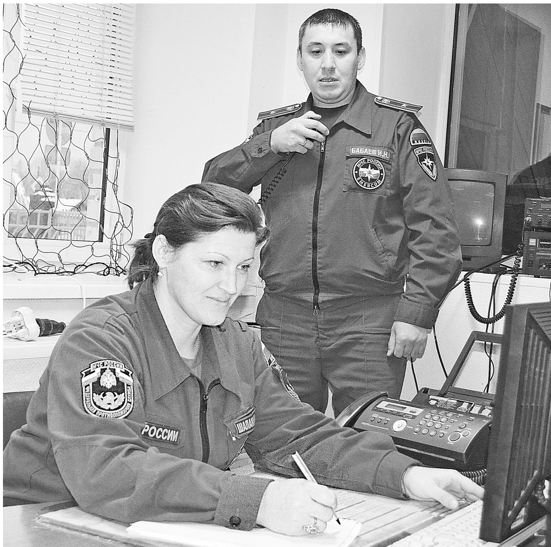
Диспетчерская служба спасения вызов приняла.

Кроме тушения пожаров, личный состав пожарной части ещё занимается и проведением аварийно-спасательных работ, к которым относится ликвидация послед-