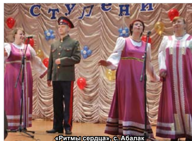
«Ритмы сердца», с. Абалак

ря средствам из областного бюджета мы смогли отремонтировать и сшить новые костюмы. Да и выступления коллективов с каждым годом становятся ярче, лучше и профессиональнее. И в этом немалая заслуга мастер-классов, на которые мы приглашаем специалистов своего дела. Знаете, когда по-