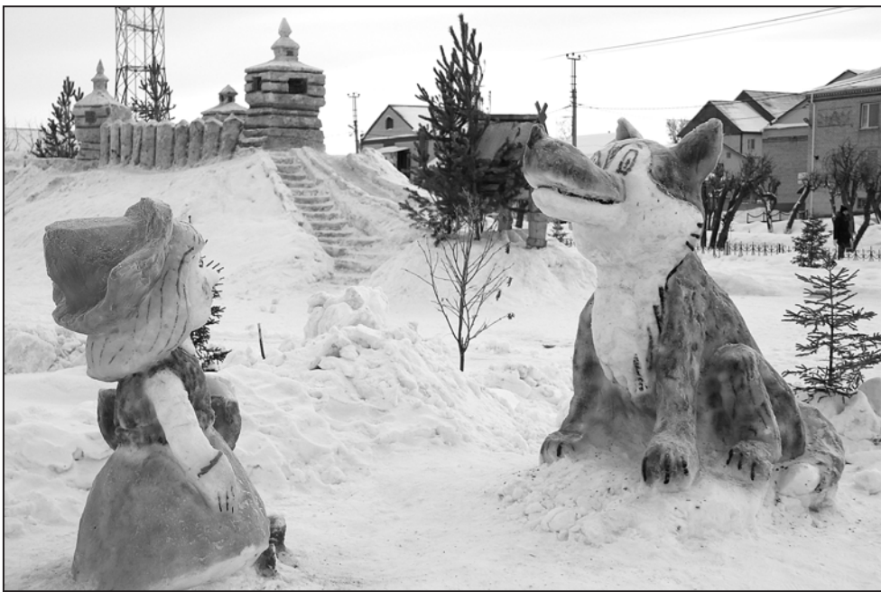
Серый волк и Красная шапочка встретят вас в центральном парке