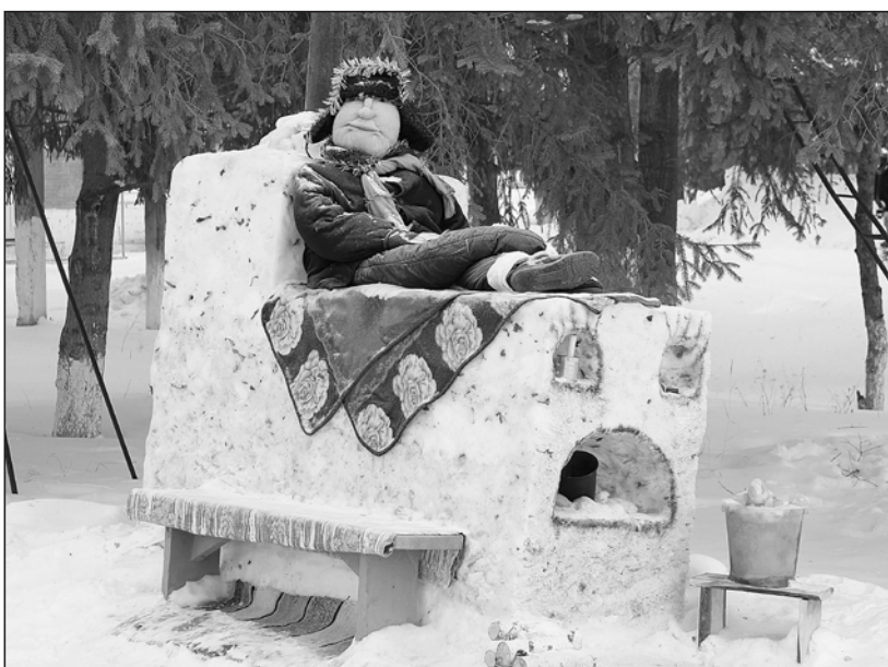
Емеля на печи – творение работников Областной больницы №11

Наталья ГЛАДКОВСКАЯ.