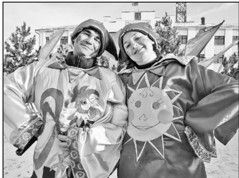
Без скоморохов ярмарки не бывает

Итак, среди сельхозтоваропроизводителей первое место было присуждено ООО «Сельхозинтеграция», второе – СХПК «Колхоз им. Кирова», третье – агрофирме «Новоселёвское».