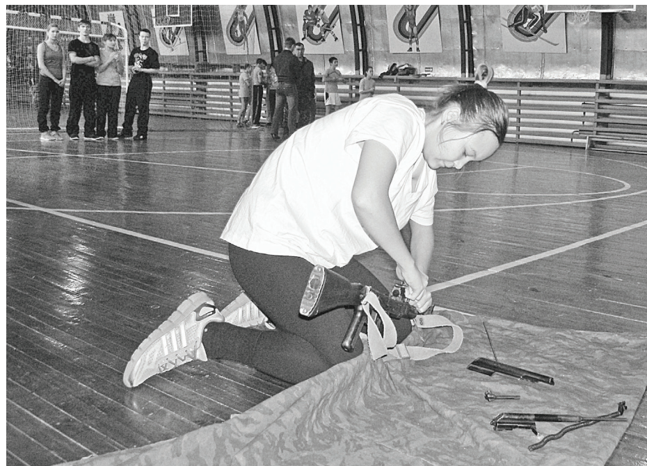
Конкурс «Военное дело». Разборка и сборка автомата Калашникова и снаряжение магазина АКМ 30 патронами. Девочки в своём умении и скорости выполнения задания не уступали мальчишкам.

Победители в различных видах состязаний чередовались, в итоге в конкурсе «Военное дело» победили кадеты из Чугунаево. «Русские витязи» и