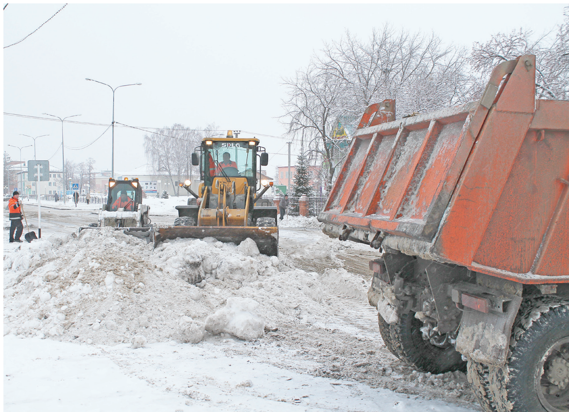
Уборка снега на улице Ленина.

Как решается вопрос в сельских поселениях? Семь единиц техники дислоцируется непосредственно в Велижанах, в остальные территории снегоуборочные машины идут