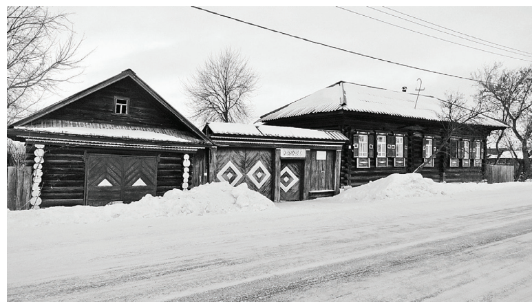
«Сибирское подворье». Усадьба сохранилась до наших дней практически в первозданном виде, что говорит об основательности его строительства. Дом напоминает собой крепость: высокая бревенчатая изба с подклетью и четырёхскатной крышей, амбар, навес для дров, баня, огромные массивные ворота...

лян конца XIX – начала XX веков. И нашли. Дом Косыгиных. Сегодня крестьянская усадьба представляет историко-культурное наследие нижнетавдинцев. «Сибирское подворье» – живой музей. Здесь встречают гостей хлебом-солью, проводят экскурсии по избе и горнице, показывая их убранство и давно забытые предметы домашнего обихода. А потом ещё и угощают рассыпчатой картошкой из чугуна, домашним салом, блинами! А какие песни исполняет в это время фольклорный ансамбль «Златница»!