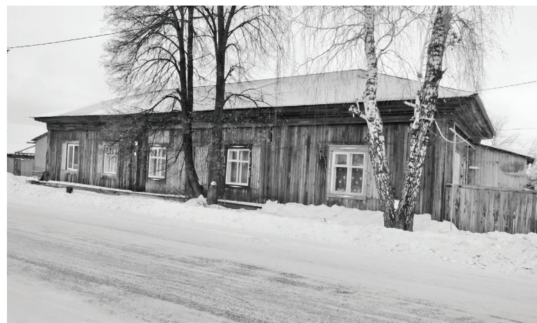
На этом же месте, в этом же доме, претерпевшем незначительные изменения, когда-то был культурный центр села – клуб, в честь которого и названа была улица Клубной.

Дело в том, что с ноября 2002 года этот дом – экспозиция Нижнетавдинского историко-краеведческого музея «Сибирское подворье». Сотрудники долго искали помещение, чтобы наилучшим образом представить историю крестьянства. Это должна была быть не просто музейная комната, а целый двор со всеми атрибутами жизни се-