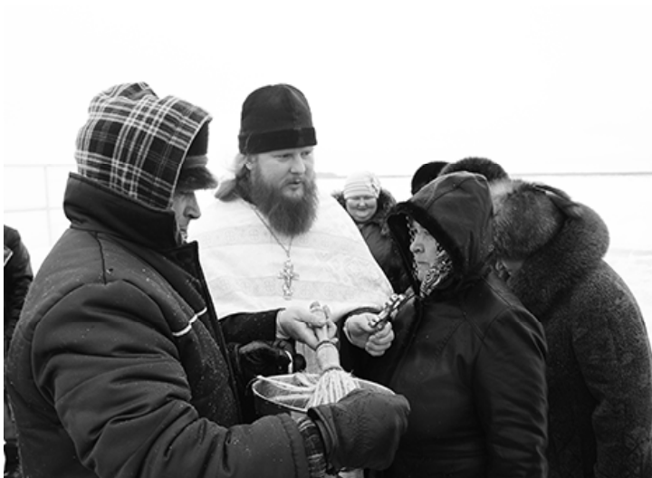
* Благословение батюшки