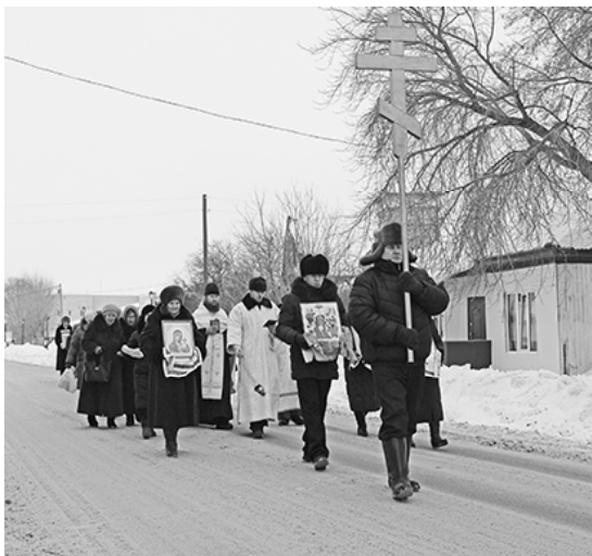
* Крестный ход