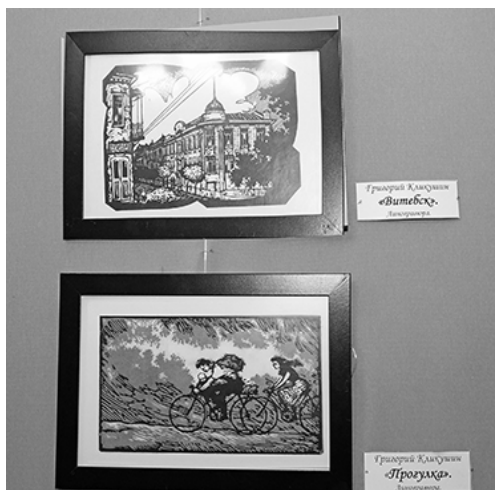
* Иллюстрации Г.Ф.Кликушина

Главное управление строительства Тюменской области