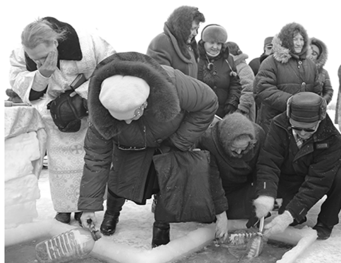
* За великой святыней