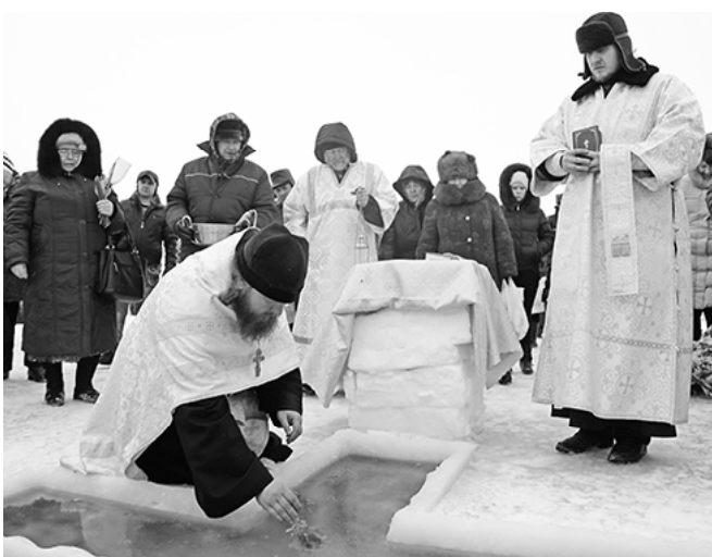
* Освящение иордани