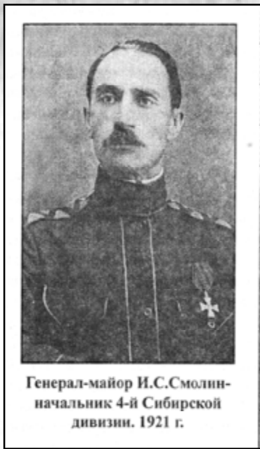
Генерал-майор И.С. Смолин - начальник 4-й Сибирской дивизии. 1921 г.