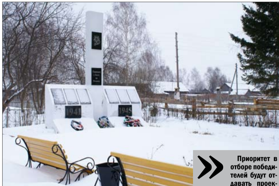
с. Ушарова

благодарительные организации. Необходимо отметить, что желающие участвовать в конкурсе должны представить в региональный исполнительный комитет партии следующие документы: заявку, содержащую описание проекта, в которой нужно указать одну из номинаций. Заявки с приложением документов подаются на бумажном носителе и в электронном виде.