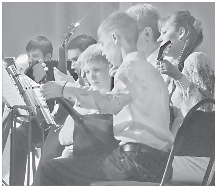
Играют ученики ДШИ