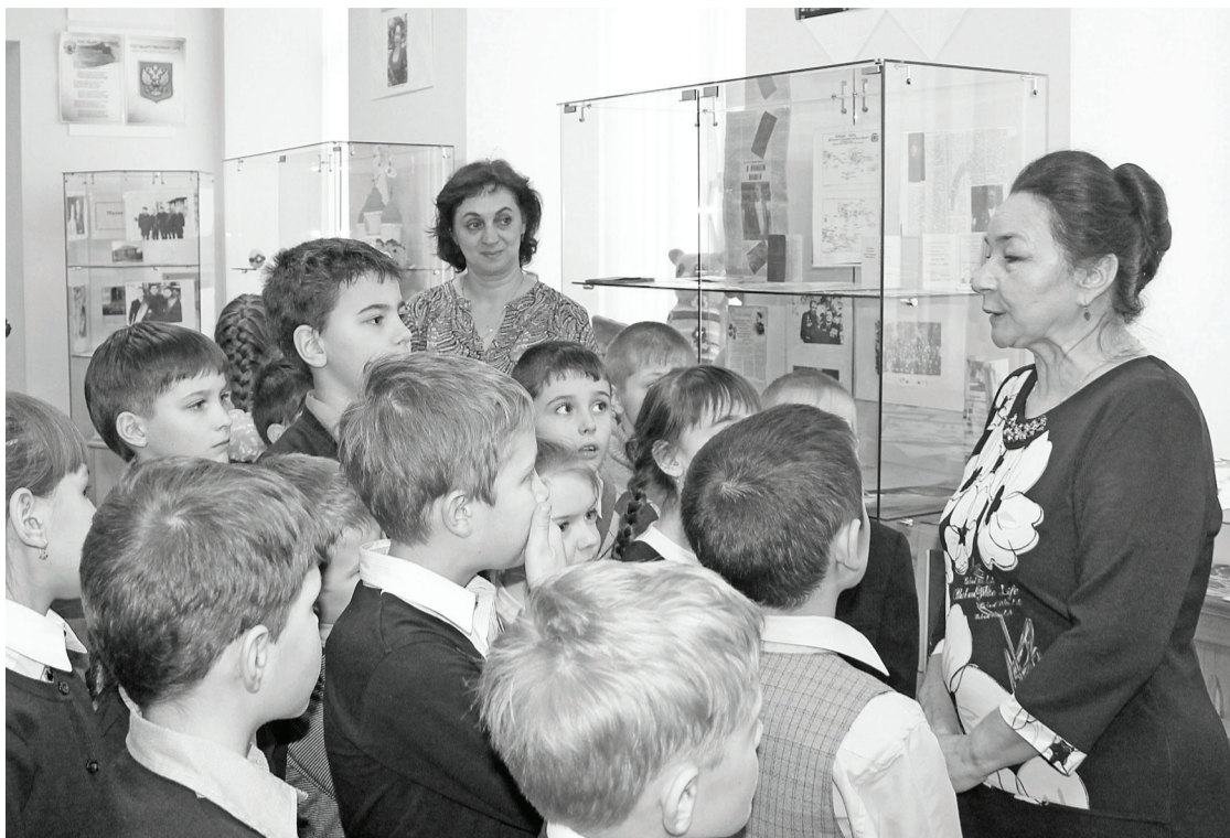
Встречи ребят с ветеранами Великой Отечественной войны, педагогического труда всегда интересны и познавательны. И фонд музейной комнаты – неплохое подспорье в этом.