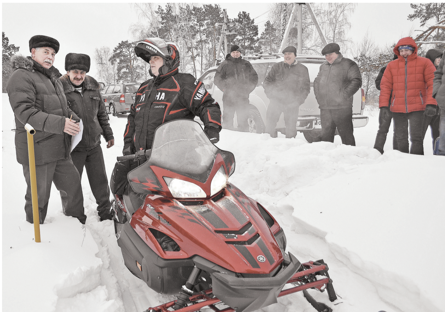
Когда всё в порядке, и разговор короткий: «Счастливого пути!».

Профилактическая операция «Снегоход» проводится постоянно. Вот и в этом году в соответствии с планом работы управления гостехнадзора Тюменской области и рекомендациями Минсельхоза России в целях обеспечения безопасной эксплуатации внедорожных транспортных средств, профилактики дорожно-транспортных происшествий, выявления незарегистрированной техники и постановки её на учёт с 1 февраля по 1 марта 2015 года в районе пройдёт операция «Снегоход».