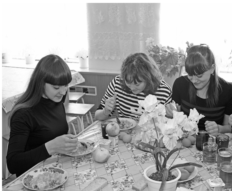
* Во время обеда