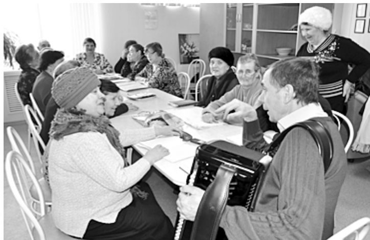
Фото и текст Тамары Бычковой.

хи об освобождении Ленинграда, о мужестве и героизме советского народа и пели легендарные песни, одна из них имеет название «Слушай, Ленинград!».