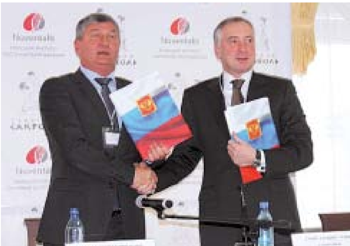
Старейшая здравница – город Саки, расположен на западном побережье Крыма, у солёного грязевого Сакского озера. В рекреационный комплекс курорта Саки входит 14 санаторно-оздоровительных учреждений. Население составляет 23,3 тыс. человек.

С ответным ознакомительным визитом делегация крымчан посетит Тобольск в феврале-марте текущего года.