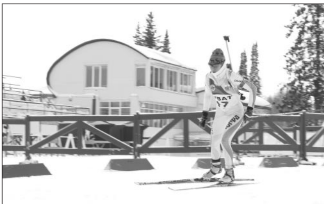
Спринтерская гонка прошла в сложных погодных условиях.

Отметим, что больше половины спортсменок, борющихся за окружное лидерство, являются делегатами Ханты-Мансийского автономного округа. Также на соревнованиях были представлены воспитанницы Челябинской, Свердловской и Тюменской