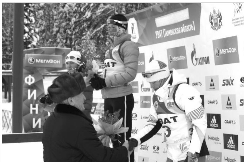
Победители женского спринта чемпионата УрФО по биатлону.