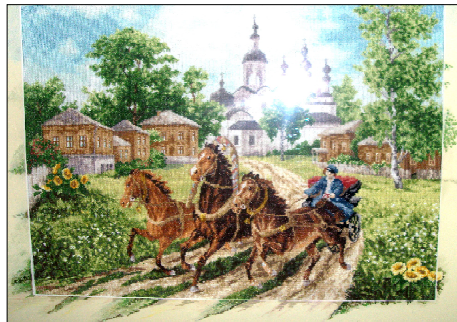
Вышивка Натальи Самоловой (с. Красный Яр).