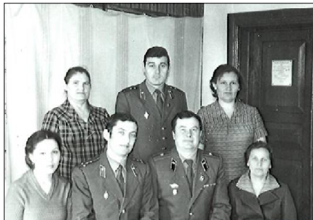
Коллектив военного комиссариата, 1984 г.

За два десятилетия трудовой деятельности в военкомате менялась не только должность. Например, пос-