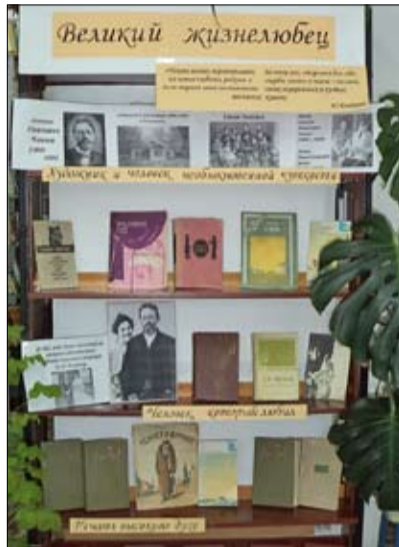
Книжная выставка в Булашово

читая, глядя по сторонам и слушая, я многое узнаю и выучу... Сахалин - это место невыносимых страданий, на какое бывает только способен человек, вольный и подневольный... Мы сгноили в тюрьмах миллионы людей, сгноили зря, без рассуждений варварски; мы гоняли людей по холоду